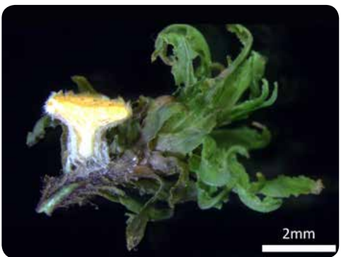
図15: ネオッチエラ・アルボキンクタ ( Neottiella albocincta ) が生えているタチゴケの茎の断面