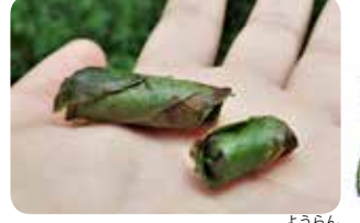
図6：オトシブミ類の揺籃