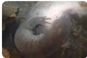
図2：クロサンショウウオ。たくさんいました

6月から開館する菅平高原自然館の入口にスクリーンを設置し、湿原の地図と生き物の写真などが投影されるようにしました。《6月6日 第1回菅平湿原観察会》 新緑に包まれる中、北海道と菅平にだけ見られる希少種、クロミサンザシが真っ白な花を咲かせていました(図4)。ほかにモタニギキョウやホウチャクソウ、コンロ