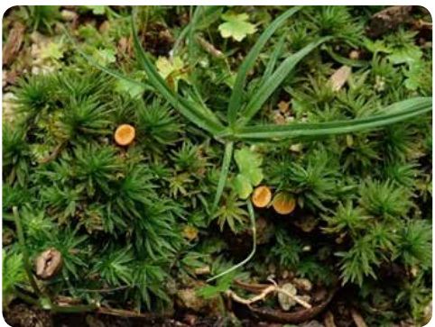
図14: タチゴケと一緒に生えているネオッチエラ・アルボキンクタ ( Neottiella albocincta )

うに菌と植物(の根)が互いに共生して栄養のやりとりをする場合や、植物病原菌のように植物に侵入して栄養を奪う場合に、植物の組織の中に菌類が入り込むことが知られています。このチャワンタケの場合は、タチゴケから直接生えているものの、タチゴケ自体は特に枯れている様子は見られず、両者がどのような関係があるのか未だ詳しいことはわかっていません。このようなコケ植物から生えるチャワンタケ類は、海外では蘚類のスギゴケ科だけでなく、ほかの蘚類や苔類の上に生える例も発見されています。ふと思いついたときに、小さな小さなコケ植物と菌類の世界をのぞいてみてください。ひよっとしたらコケ植物から生えるこんなに不思議でかわいらしいチャワンタケが皆さんの周りでも見つかるかもしれません。