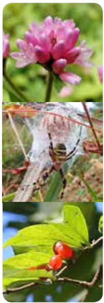
図9(上)：ミゾソバ、図10(中)：ナガコガネグモと卵のう、図11(下)：ハナヒヨウタンボクの果実