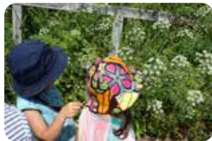
図7：子供たちも観察！

標高が高く日差しの厳しい菅平ですが、木陰に入ると涼しい風が体を癒します。短い夏を謳歌するようにオオバギボウシ、バ イケイソウ、ツリフネソウ、ノリウツギといったたくさんの花が咲き、虫たちも数多く訪れていました。 《9月3日 第4回》 早くも秋の気配。ミゾソバ(図9)とアキノウナギツカミの花は小さいですが、近くで見ると可憐な形をしていることが分かります。菅平湿原で新種として発