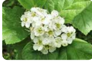
図4：クロミサンザシの花

ンソウも見られ、湿原は活気づいてきました。カラコギカエデの花からは香りが漂い、水中にはクロサンショウウオのオタマジャクシの姿がありました。