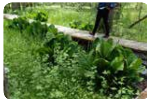
図3：大きくなったミズバショウの株があちこちに

6月から開館する菅平高原自然館の入口にスクリーンを設置し、湿原の地図と生き物の写真などが投影されるようにしました。《6月6日 第1回菅平湿原観察会》 新緑に包まれる中、北海道と菅平にだけ見られる希少種、クロミサンザシが真っ白な花を咲かせていました(図4)。ほかにモタニギキョウやホウチャクソウ、コンロ