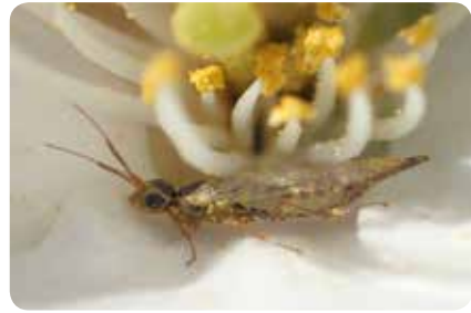
図13：マダラナギナタハバチの雌