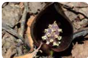
図8：ヒメザゼンソウ。第3回では花が見られました