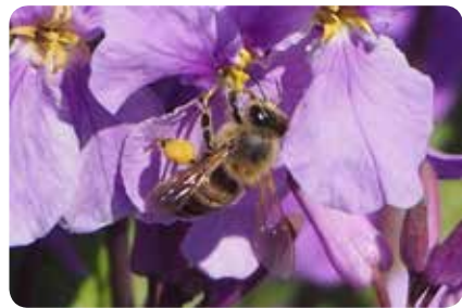
図12：セイヨウミツバチの雌

図9(上)：ミゾソバ、図10(中)：ナガコガネグモと卵のう、図11(下)：ハナヒヨウタンボクの果実