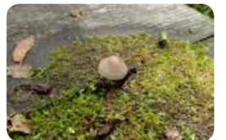
図5：木道の隙間に小さなキノコが

この日咲いていたカラフトイバラは菅平と北海道、群馬県の一部などに分布する氷河期時代の生き残りで「遺存種」と呼ばれます。菅平は冷気がたまりやすいため、このような希少種がいくつも見られます。地面からはヒメザゼンソウがわずかに顔をのぞかせ、前回咲いていたカラコギカエデは