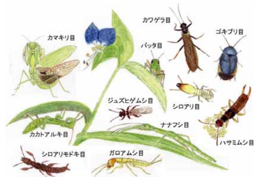
図1：多新翅類の仲間たち（イラスト提供：藤田麻里氏（神奈川県立生命の星・地球博物館））

身近な昆虫である、カマをこまえた恐ろしい姿のカマキリ、平たくてすばやく走るゴキブリ、家を食べしてしまうシロアリ、それぞれ個性的な昆虫ですが、実はこれらは兄弟姉妹で、多新翅類と呼ばれる仲間です。多新翅類は、11目（目は分類のランク）、すなわちジュズヒゲムシ目、ハサミムシ目、カワゲラ目、バッタ目、カカトアルキ目、ガロアムシ目、ナナフシ目、シロアリモドキ目、カマキリ目、ゴキブリ目、シロアリ目からなるグループです（図1）。