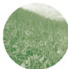
何度登っても ササばかり